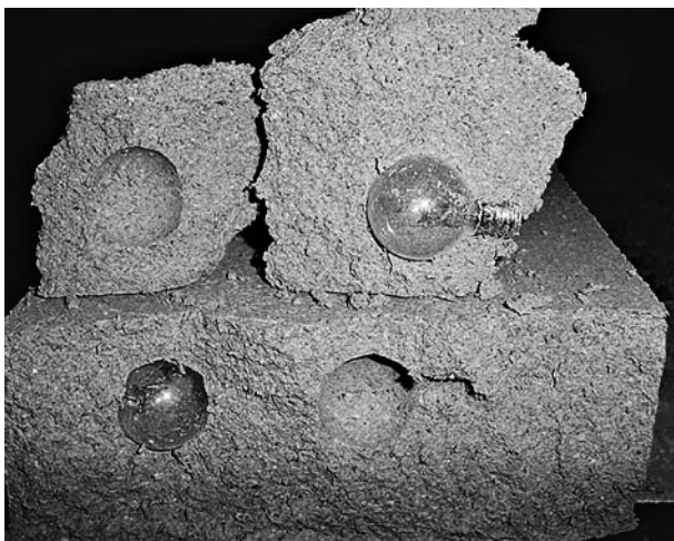
Рис. 2. Результат эксперимента с лампочками, оказавшимися внутри отформованного блока

ло бы России стать лидером в обработке порошкообразных материалов. При этом во много раз сократились бы расходы энергии, материалов и человеческого труда на единицу продукции без ущерба для ее качества: применение технологии повышает качество продукции до максимально возможного.